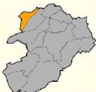
Lage von Cunnersdorf in Bannewitz

Koordinaten: 51°0'3"N,13°42'22"O Höhe: 254-276 m ü.N Einwohner: 459 (31. Dez. 2007) Eingemeindung: 1. Juli 1950 Postleitzahl: 01728 Vorwahl: 0351